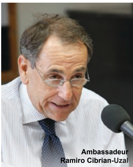
Ambassadeur Ramiro Cibrian-Uzal

Bovenstaande woorden zijn van Ramiro Cibrian-Uzal , al vier jaar Ambassadeur van de EU in Israël. Hij was één van de sprekers (zie pag. 7/8) op de internationale conferentie die eind juni in Jeruzalem plaats vond.