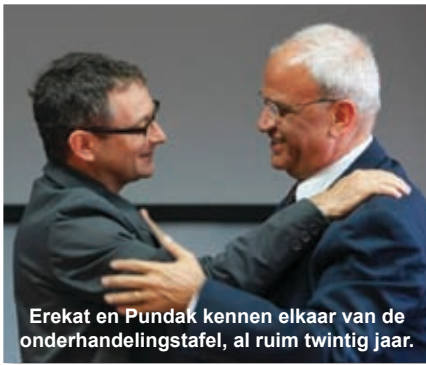
Erekat en Pundak kennen elkaar van de onderhandelingstafel, al ruim twintig jaar.