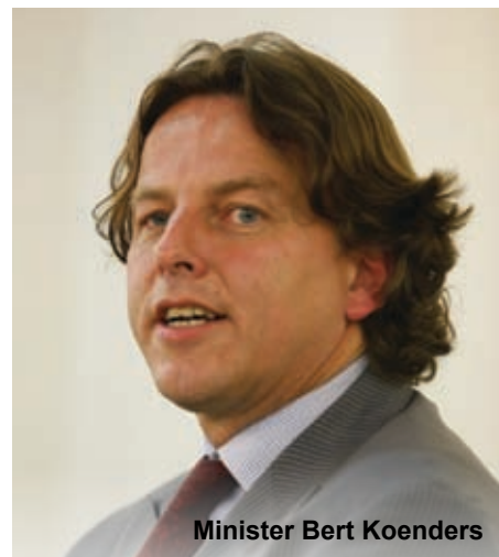
Minister Bert Koenders